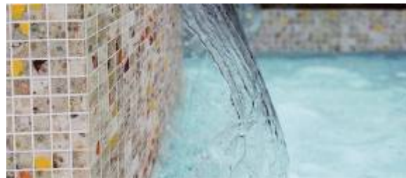
Revestimentos em resina e vidro exclusivos Mottalinidesign

Pavilhão Italiano Revestimentos: Bundles, Bruno Zanetti, CMT di P. Vatteroni, Edimax – Astor Gruppo Beta, Gruppo Ceramiche Gambarelli, LMPA di A. e A. Ratti & C, Marmi e Graniti D'Itália Sicilmarmi, MGM Furnari Marmi e Pietre, Mottalini Design, Odorizzi Porfidi e Ziche Divisione Marmi