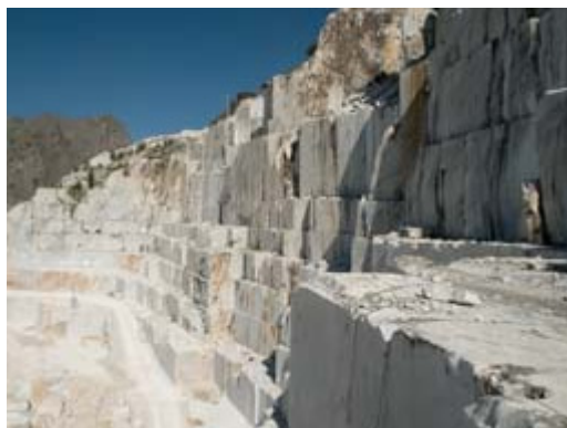
Pedreira de Carrara, região da Toscana, Itália

Reconhecidos mundialmente pela sofisticação que conferem ao ambiente e pela nobreza de seus produtos, as rochas ornamentais italianas são utilizadas na arquitetura há milhares de anos. Com valor estético e durabilidade contestáveis os revestimentos ajudam a compor ambientes sofisticados e permitem diversas aplicações, tanto em áreas internas quanto externas, como em molduras, colunas, pisos, paredes e bancadas, entre outros. Uma das mais famosas rochas ornamentais italianas é o Mármore de Carrara, encontrado na Região da Toscana.