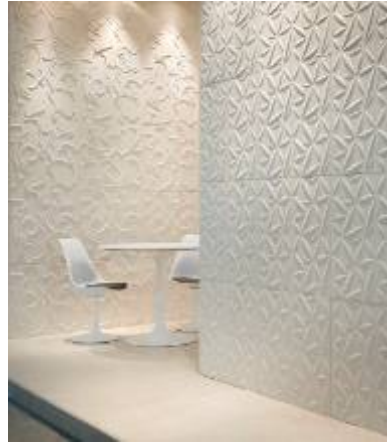
Detalhe de revestimentos em mármore e outros materiais rochosos realizados pela MGM Funari